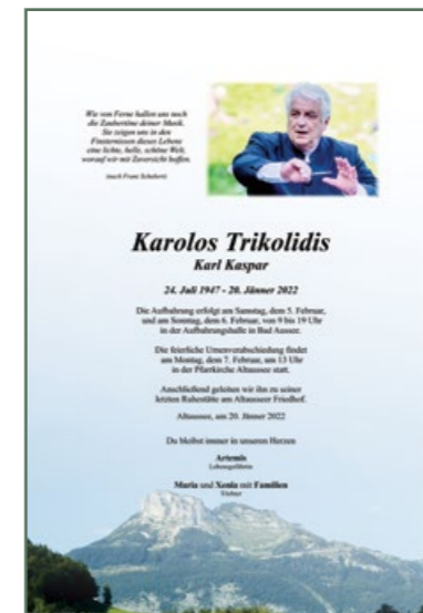
Η κηδεία του Κάρουλου Τρικολίδη πραγματοποιήθηκε την Δευτέρα 7 Φεβρουαρίου 2022 στο κοιμητήριο του Altausseee, στην Αυστρία, στον τόπο που γεννήθηκε και που άφησε την τελευταία του πνοή.

1992, 2000-2001. Ο Τρικολίδης συνετέλεσε καθοριστικά στην ποιοτική αναβάθμιση της ορχήστρας και συνέβαλλε τα μέγιστα στην προσθήκη μεγάλων και σημαντικών έργων στο ρεπερτόριο της, καθώς και στην παρουσίαση πλήθους πρώτων εκτελέσεων από την Κ.Ο.Θ.